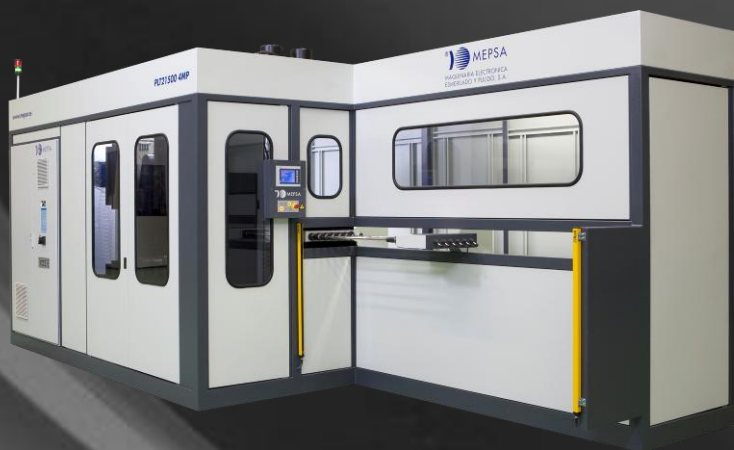
Tubos y perfiles