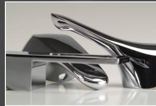
Grifería sanitaria Accesorios de baño